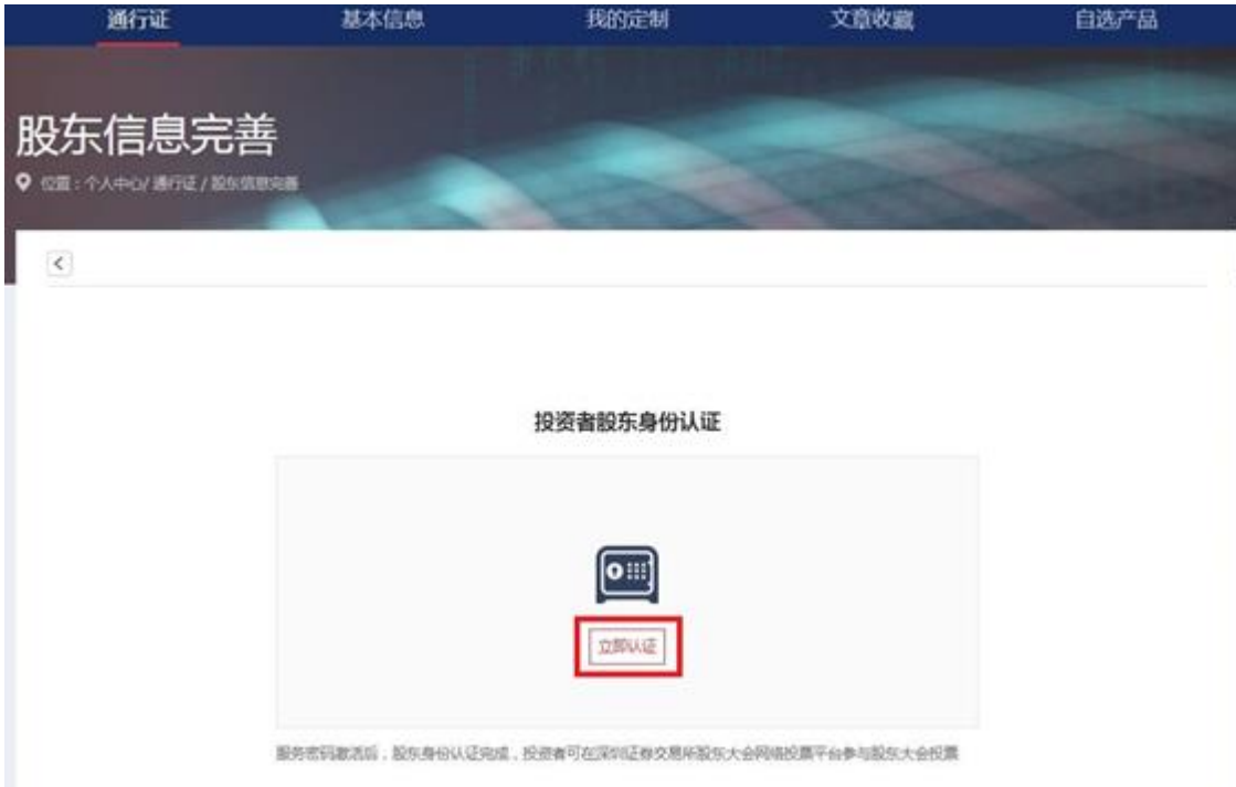
投资者股东身份认证--立即认证