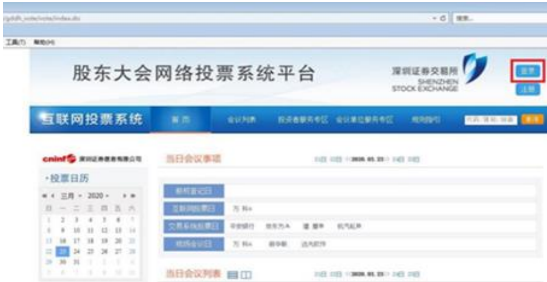
互联网投票系统首页

2. 普通投资者请点击“用户名密码登录”按钮、机构投资者请点击“CA证书登录”按钮，系统跳转至登录页面。