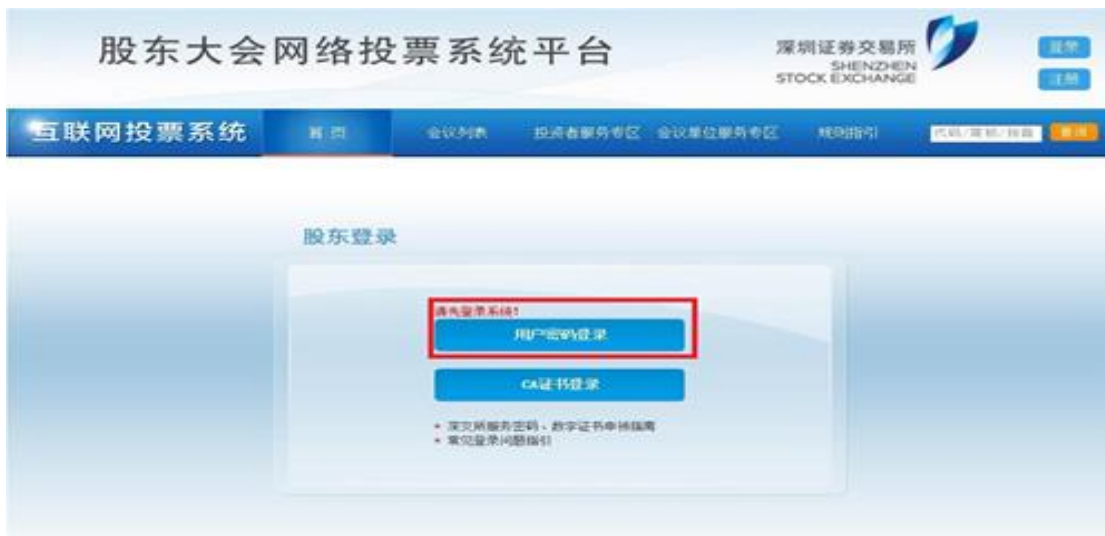
普通用户密码登录页面

2. 普通投资者请点击“用户名密码登录”按钮、机构投资者请点击“CA证书登录”按钮，系统跳转至登录页面。