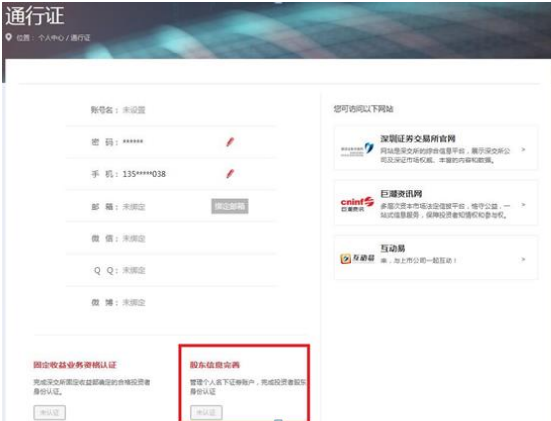
投资者服务通行证页面

1. 登录“互联网投票系统”跳转至深交所投资者服务通行证页面，点击“股东信息完善”开始认证投资者股东信息。